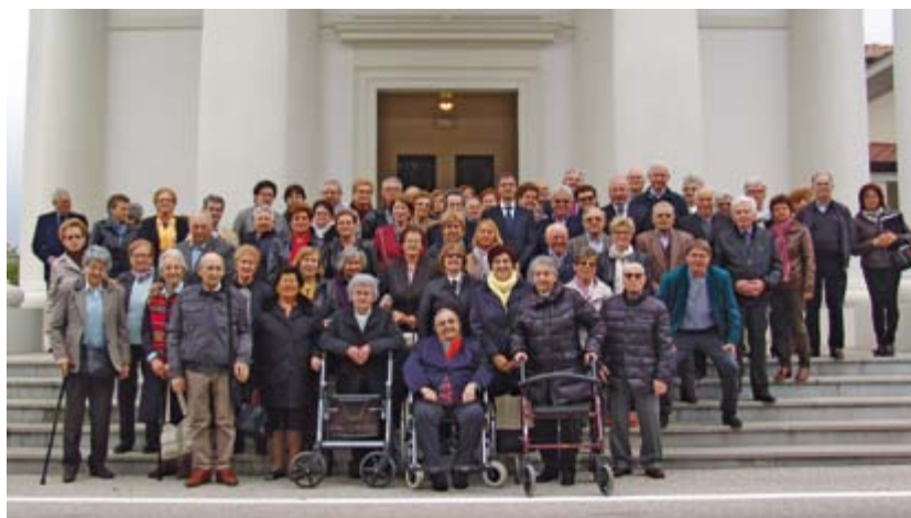
Foto di gruppo all'uscita della chiesa.