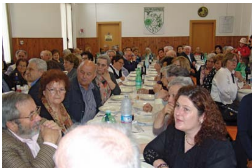
In attesa del pranzo.