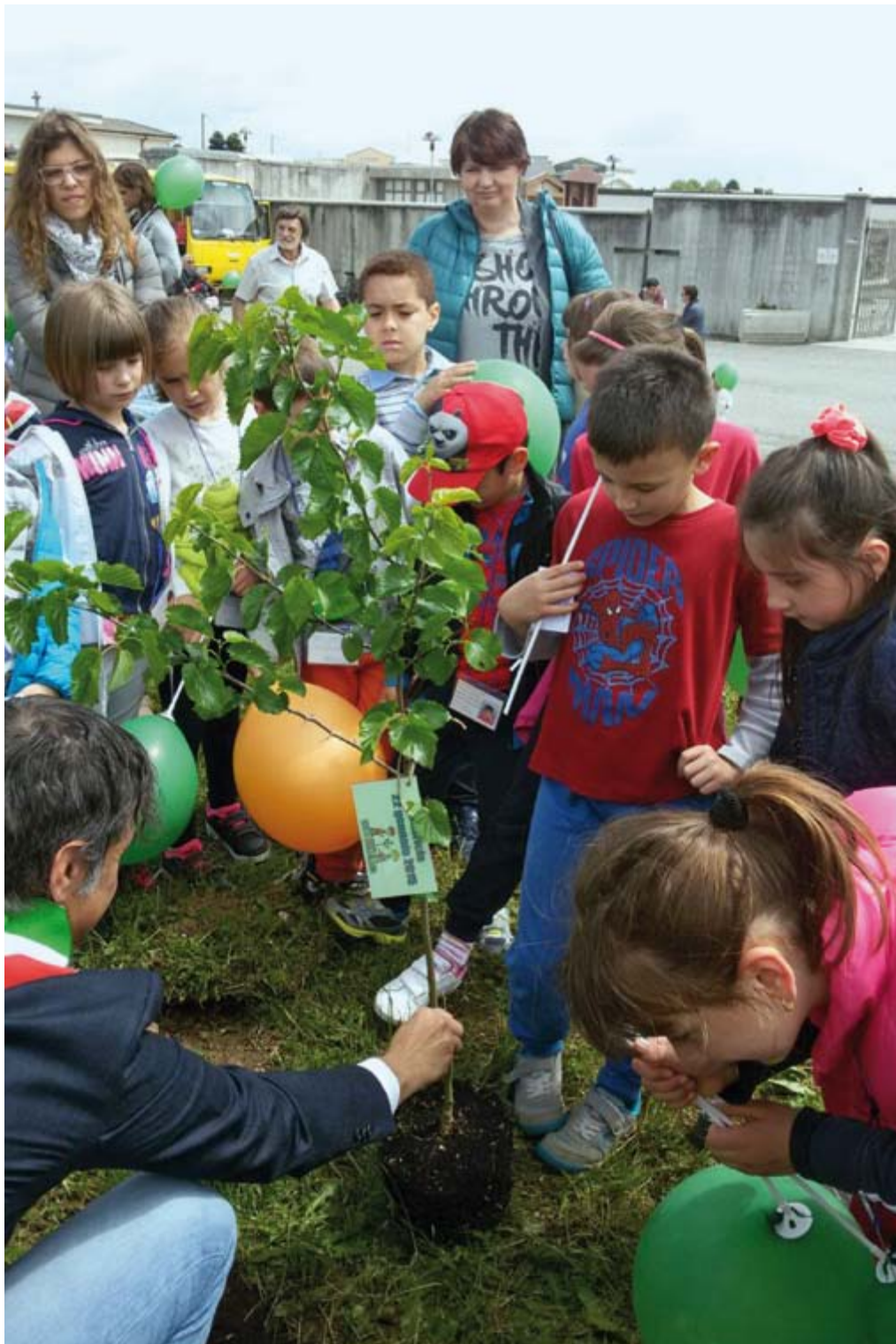
La Festa degli alberi.

PERIODICO INFORMATIVO DEL COMUNE DI DIGNANO