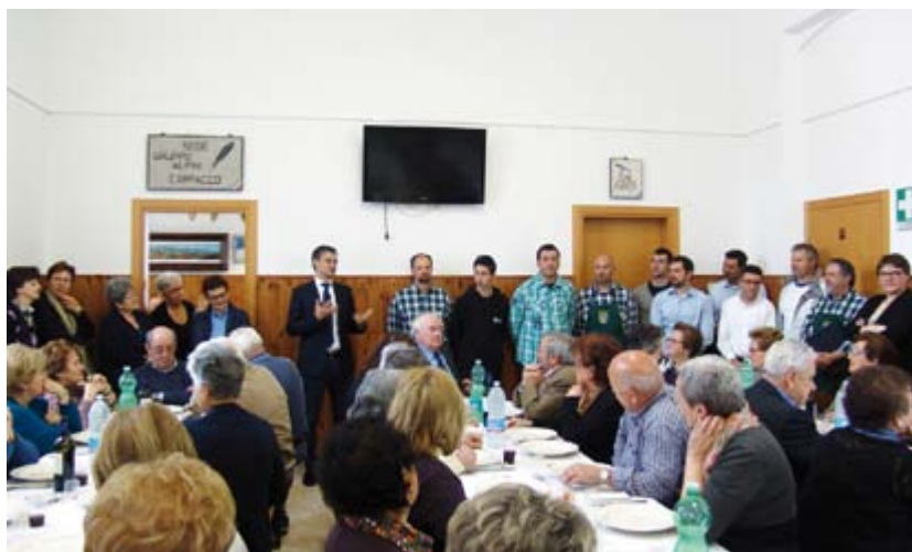
Il saluto del Sindaco.