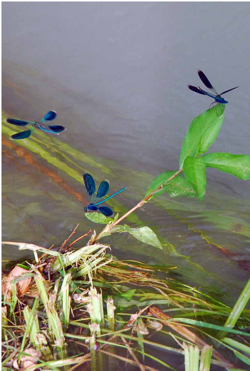
L'estât sul Tiliment.

PERIODICO INFORMATIVO DEL COMUNE DI DIGNANO