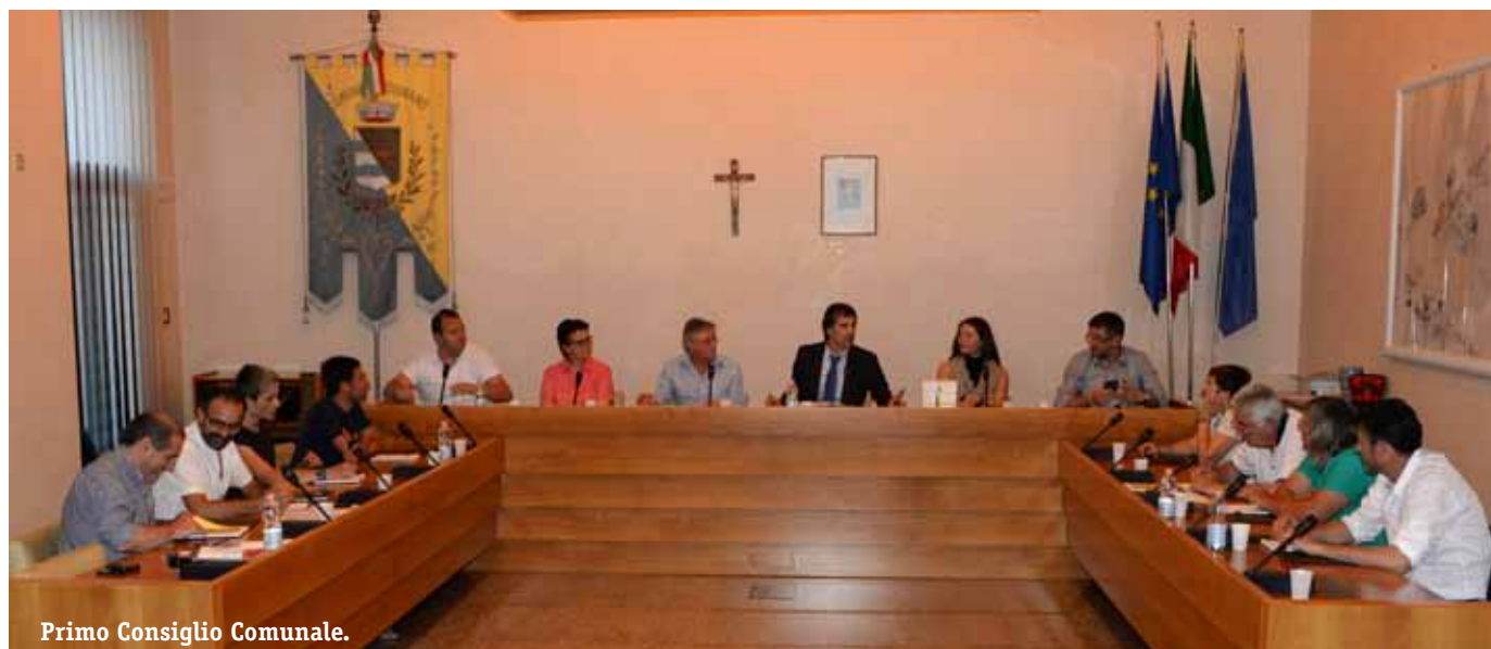
Primo Consiglio Comunale.