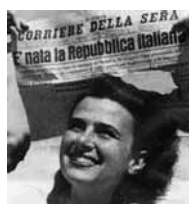
2 giugno 1946 Nascita della Repubblica Italiana

L'Amministrazione Comunale di Dignano incontra i diciottenni in occasione della festa della Repubblica, nella Sala Consiliare del Comune Sabato 1 Giugno alle ore 19.00.